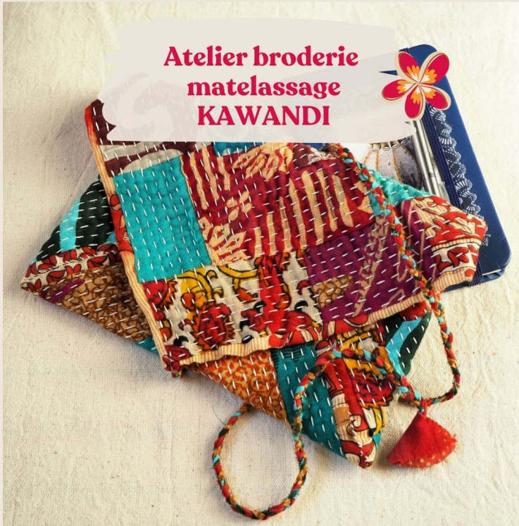
Atelier broderie matelassage KAWANDI