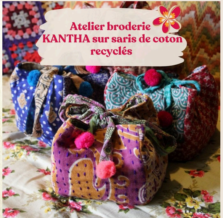
Atelier broderie KANTHA sur saris de coton recyclés