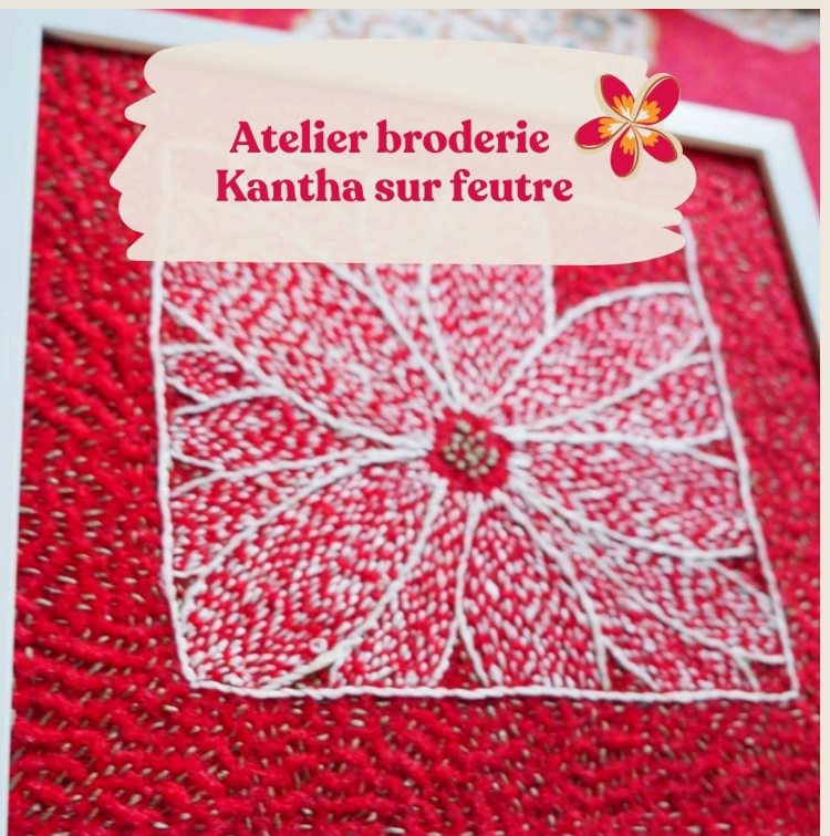
Atelier broderie Kantha sur feutre